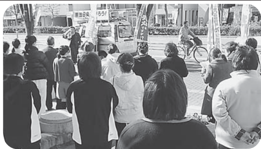
市役所前に110人が集まった