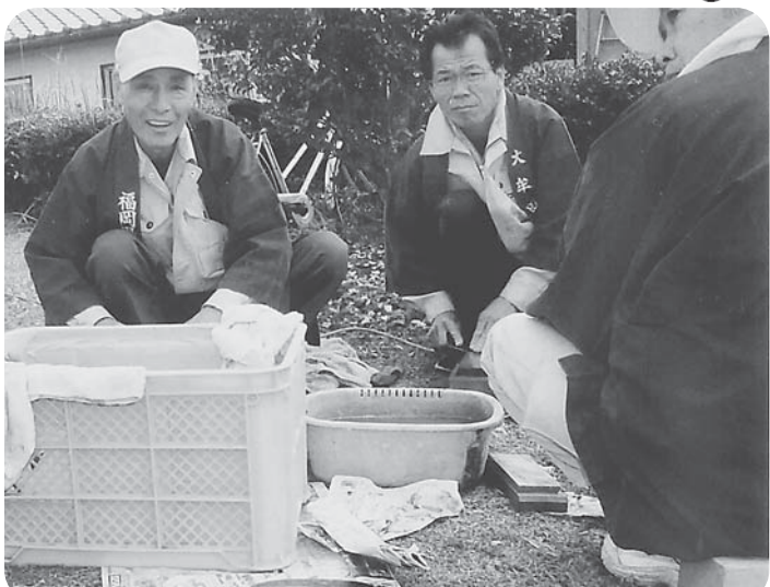
100本を超える包丁研ぎ依頼に大忙し

包丁研ぎなど110本、まな板削り17枚でした。木工教室も開催。「毎年、楽しみにしています」と声をかけてくださる方もおられ、祭りの1コーナーとしてなくてはならないものになっています。今年も、包丁とぎのお礼などで集まった5千円を、南関町の社協に寄付しました。住宅相談では、床とサッシの交換の相談等がありました。