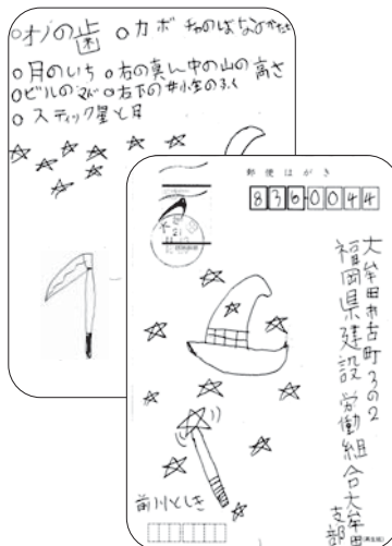
【前川としきくん・松原】

【先月の答】①カマの先 ②月の位置 ③右下の女性の肩のひも ④つえの星が月 ⑤中央のお面 ⑥右端の木の高さ ⑦ビルの窓がひとつ少ない