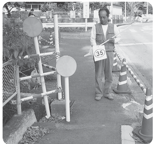
歩道が極端に狭い（勝立）