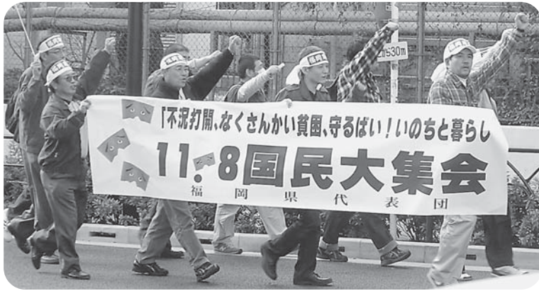
3万5千人が街中を縦横無尽にデモ行進

11月8日、東京で国民大集会が開催され、全国から3万5千人、福建労21人、大牟田から石本支部長と私が参加しました。 会場は、全国各地の参加者で埋め尽くされ、身動きもできないほどでした。 各団体から、派遣・非正規雇用などの労働問題、後期高齢者医療制度をはじめとする医療福祉問題、反核平和の活動など、仕事と暮らしに関わる様々な課題とともに、要求実現にむけた決意表明がなされました。 現状を少しでも変えるべく、集まった参加者の思いは、集会をめぐめるデモ行進で、大きな声のシュプレヒコールとなつて、街中に拡がりました。 (宮本和美)