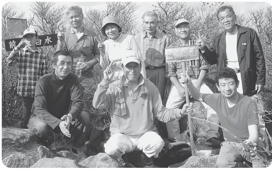
登山組・黒岳高塚山頂(1587m)にて

11月8日(日)、大牟田支部恒例の秋の山登りを10歳の小学生から78歳までの総勢18人で、急登で有名な黒岳