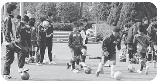
サガン鳥栖の選手とプレー

10月15日、大牟田諏訪公園にてWHO健康ウォークを4団体実行委員会で開催しました。当日は、冷え込みも出始めた冬晴れの中で行われましたが、参加者は230名も集まり(うち78名はサッカー教室)ました。開会式の後、諏訪公園内周りを4kmと8kmのコースを歩くウォー