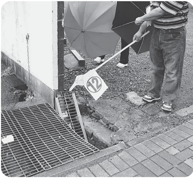
側溝の蓋が欠落し、危険（三池）

【勝立校区】 11月4日には勝立地区で福建労から3名参加し他団体とあわせて8名で実施。車の交通量が多い道路に歩道がなく危険。フェンスがない橋があり転落の危険がある。手で押すと倒れそうな腐った木がそのまま。道路に穴が開いており転倒の危険。など、いづれも通学路でもあり早急な改善が必要。通常に通ることも不便な場所もあることが、わかりました。