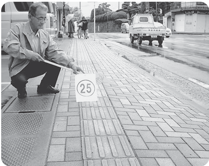
歩道の傾斜がひどく車いすの通行ができない（吉野）