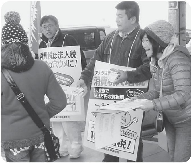
よびかけに答え、多くの方が署名してくれました