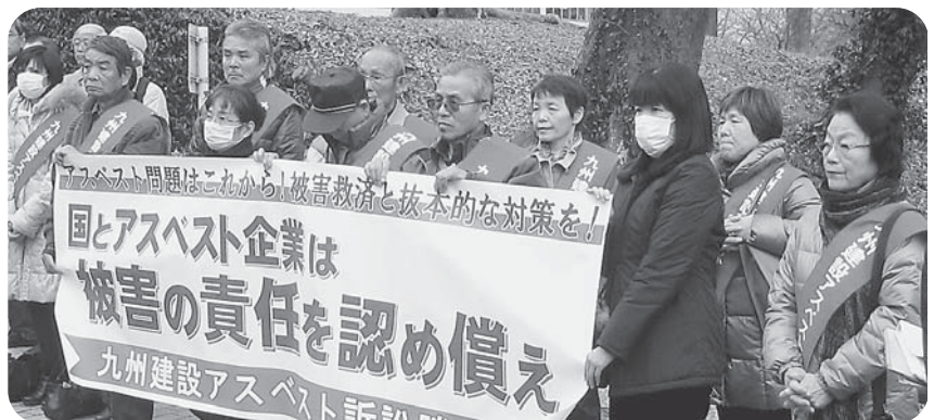
福岡地裁前での門前集会の原告団