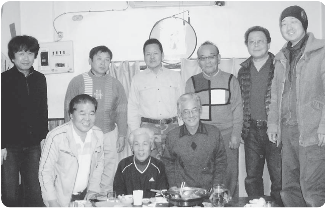
今月間も分会目標達成へ向けてがんばろうと決意

1月14日(土) 18時30分から班長・役員の新年会を竹林(やきとり屋)にて、9名の参加で開催しました。宣伝行動やポールの大会の参加を呼びかけ、秋の拡大行動の分会目標も達成して2年続けて秋の目標を達成。今年の春の拡大について、2月か