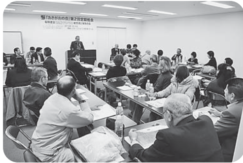
勝利をめぐして第2回総会

この総会で、新たに大牟田支部の原告である... 勝利のためにお互いの力を合わせて頑張っていくことなどを確かめました。