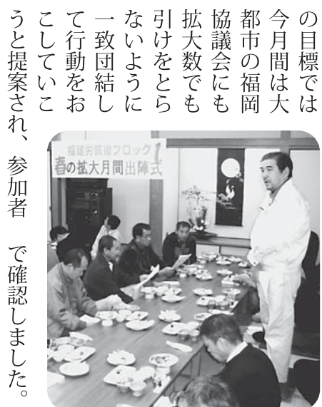
団結してがんばろうと決意

1月20日、久留米、浮羽、筑後、八女、大牟田の各支部から43名が参加して、筑後協議会の春の拡大月間を成功させるために出陣式が大牟田で開催されました。