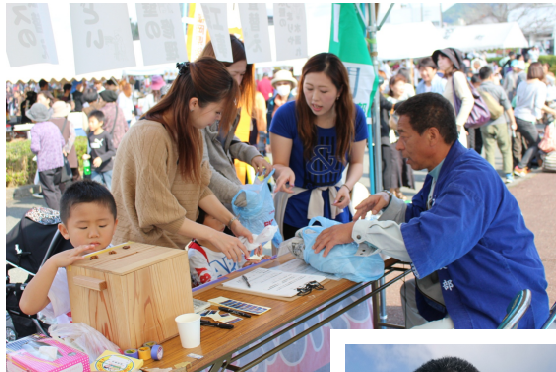
↑受付も次から次へくるお客さんで大忙し