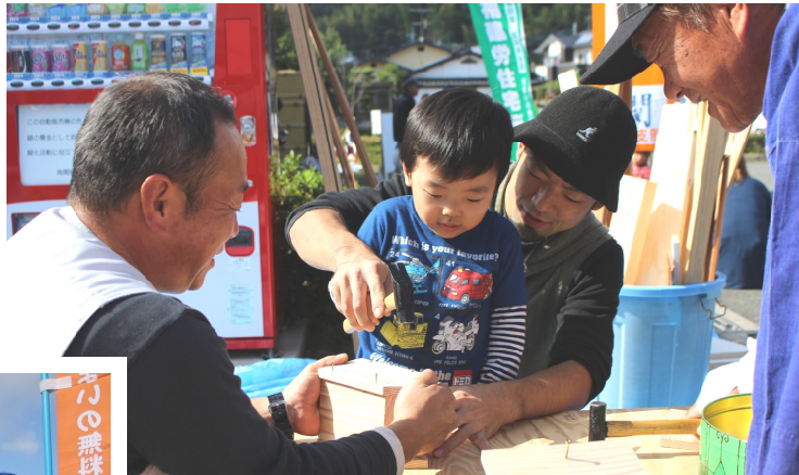
←↑木工教室は毎年大人気