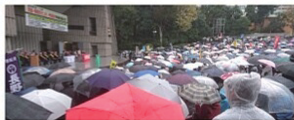
参加者で埋め尽くされた日比谷公園

2組に分かれ議員室をまわりましたが、議員本人は不在が多く秘書の方などへ議員本人から財務省と厚生労働省へ直接要請の趣旨を伝えてもらうようお願いしました。 議員要請の後、日比谷公園と日比谷公会堂で開催された全建総連で開催された全建総連・予算要求中央総決起大会に参加しました。会場には全国から集まった5000人を超える仲間が雨のなか集まりました。 来賓には各政党から代表者も参加し、賃金引き上げや社会保障の充実など、ともにがんばりましょうと挨拶があり壇上で要請書を受け取りました。 基調報告と埼玉土建、全建愛知からの決意表明のあと、自らの仕事とくらしを変え、人の育つ建設産業に代えていくために更に取り組んで来たかっけて行くこと