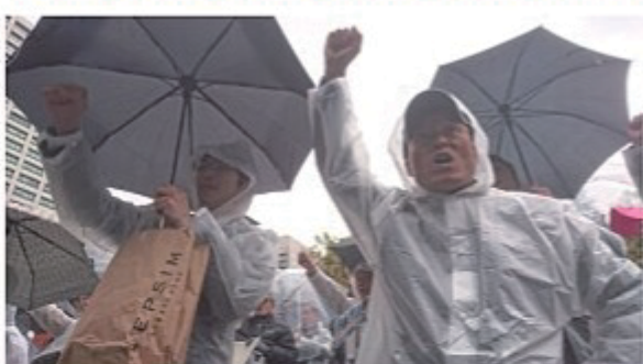
永江副支部長（右）もカッパを着て参加

マイナンバー制度開始により、中建国保加入者の方は、個人番号の登録が必要となりました。 中建国保本部から送られてくる個人番号申告書に、本人分の「番号通知カード」と「保険証」のコピーを貼付け、家族の方で中建国保に加入している方は、家族の個人番号を記入し中建国保本部へ簡易書留（受取人払）で返信をお願いします。 不明な点があれば、組合事務局までご連絡ください。