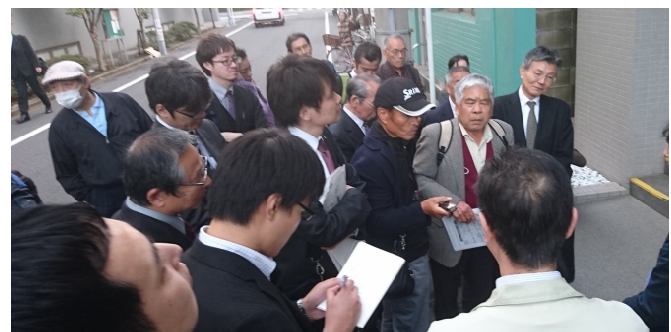
なんとか話し合いの場を設けてほしいと企業へ交渉

1日かけて祭りに訪れる多くのお客さんへ、地元には福建労の職人がいることをアピールしました。