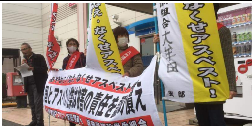
買物で大勢が行きかう中宣伝

春の拡大月間が本月間に突入しました。みなさんの声掛けのおかげで、同業者の紹介や 従業員を健保適用除外で中建国保へ加入するなど準備月間に超過達成することができ 本月間では、さらに全分会での目標達成めざし、組合員訪問も行っていきます。 引き続き、現場や仕事仲間 で困っている方には、「組合に相談してみらんね」と声掛けをお願いします。