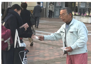
西鉄大牟田駅にて宣伝

この行動は、各分会の役員が最寄りの駅頭で、出勤する労働者や消費者に理解を求め、ために毎年おこなっているものです。公共工事の設計労務単価が5年連続で引上