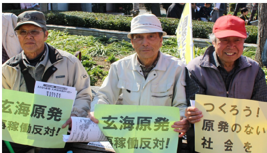
プラカード掲げ玄海原発再稼働を反対