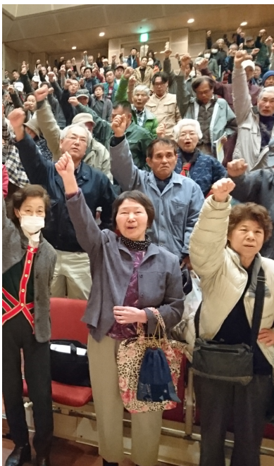
大牟田文化会館での集会