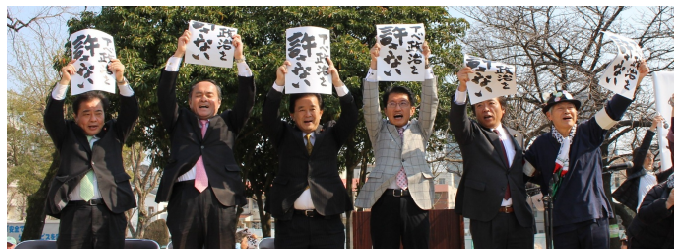
壇上で野党の議員も一緒に声をあげました

最後は福岡の街中に「政治を変えよう」とシュプレヒコールを響かせデモ行進しました。