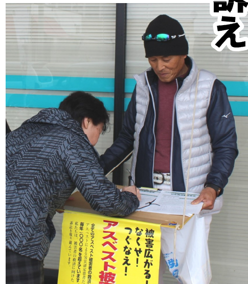
買物中のお客さんにうったえ署名

縮切が4月末までの取り組みとなっております。必ず20筆を埋めて提出家族や親せき、友人、知人等に署名をひろげ、