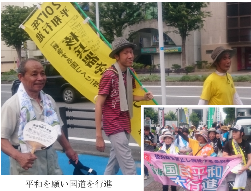
平和を願い国道を行進

組合では被災者支援の500円ワンコインカンパを行います。カンパは分会を通じて集めますので、ご協力をお願いします。