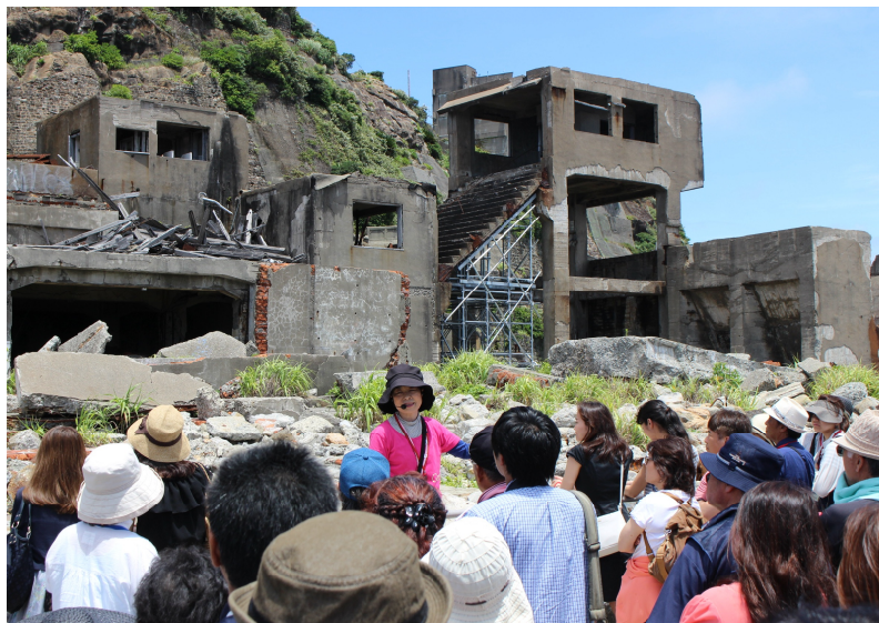
見学ポイントで当時の過酷な労働と近代的な生活を説明

5月の天草バスツアーに引き続き大牟田支部バスツアーの第2弾として、世界文化遺産に登録された長崎の「端島炭坑」、通称「軍艦島」へのバスツアーを7月3日(日)に、38名の参加で行いました。組合では昨年の8月にも開催しましたが、今回は悪天候により波が高くて島には上陸出来なかったのが、今回はそのリベンジです。行きのバスの中では、軍艦島についてのDVD