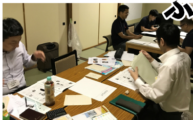
手書きで新聞を作成

また、教宣活動の重要性を知る絶好の場でも、勉強になりました。今後の拡大ニューズや機関紙作成に役立てていきたいです。(西原通信員)