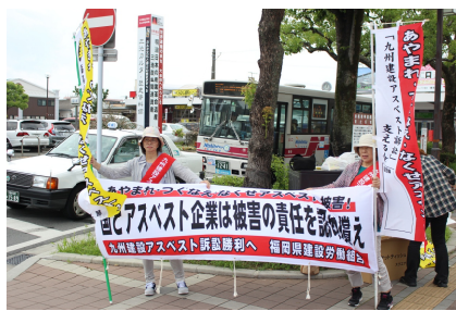
アスベスト企業は被害の責任を認めろ