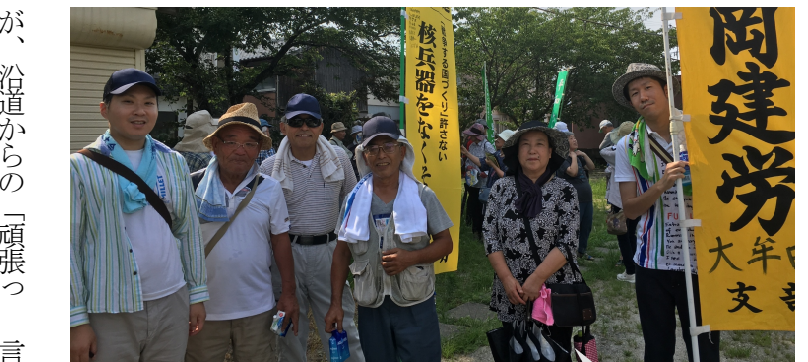
四ツ山公園での引継ぎ集会

7月22日に四ツ山公園で熊本の仲間から平和のタスキを受継ぎ、大牟田市役所まで行進。組合からは8名が参加。この日は大牟田大蛇山祭りの真っ最中ということもあり、沿道を歩いている人も多く活気ある中での行進で、道中に白大蛇に遭遇するなど今までにないものとなりました。