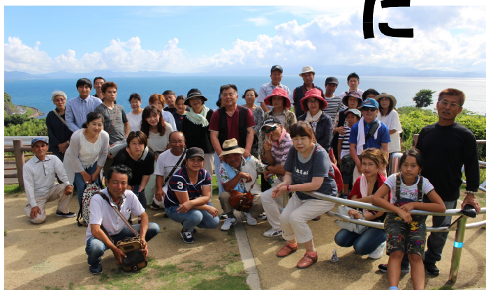
参加者と大村湾で記念撮影

Dで島の歴史を学び、なぞなぞやクイズで盛り上がりながら長崎市内へ向かいました。長崎港から船に乗り