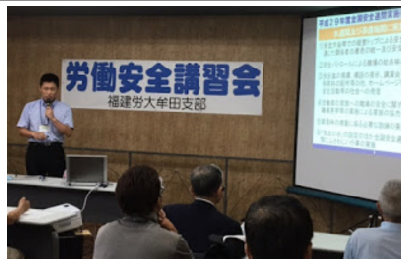
監督署から講師を招き学習

足場の組立等の作業に従事するようになった方は通常の6時間の講習が必要です。右記日程で特別講習(6時間)受講者の募集をします。申し込みは、組合まで連絡をお願いします。 ●開催日程 8月16日(水) ●時間 9:00~17:00 ●講習時間 6時間 ●会場 組合事務所3F ●受講料 組合員7,000円 組合外9,000円