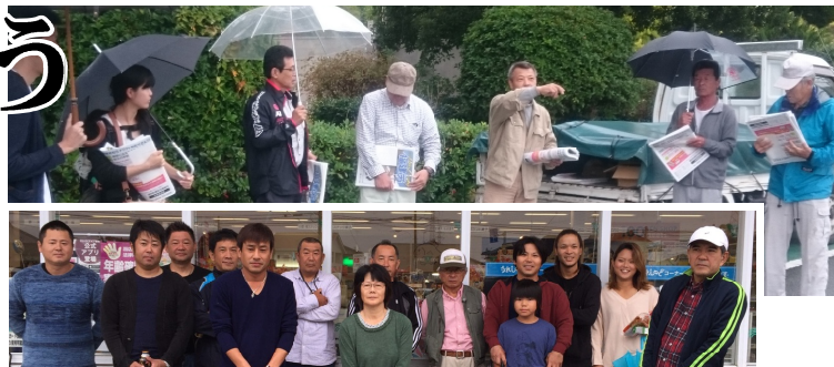
↑⑤明治公園（白光分会）と⑦くらし館（田隈分会）で集合して配布地域を確認