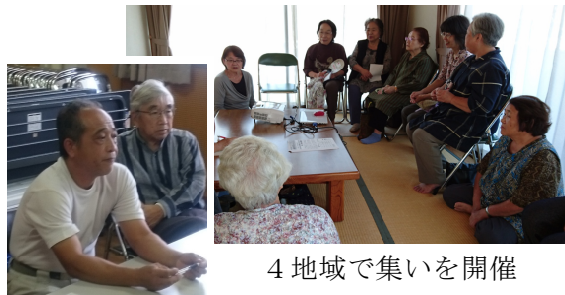
4地域で集いを開催

今年度の街角ウォッチングは、4つの地域（甘木・倉永・勝立・三池）で集いの場を設けて住民の方にも参加を呼びかけ、各地域の問題点や危険箇所など意見を出し合いました。集いの中で、学校ウォッチングから街角ウォッチングへと活動をかえてきた歴史や行動で多くの改善をする事が出来たことをスライドを見ながら説明をうけ、意見を出し合いました。