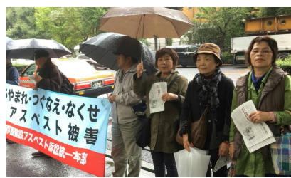
厚労省前での宣伝行動