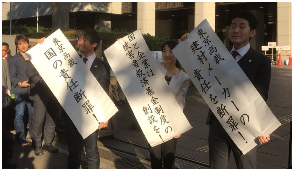
東京高裁まえにて、勝利の旗出し (10/27)