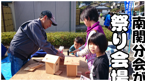
毎年木工教室が大人気

※●●に県名。▲▲には職種(大工、左官、土工、塗装工、内装工、電工など)を記入してください。▲▲業(ギョウ)はダメです。