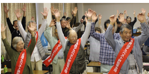
横浜地裁での勝利にバンザイ!

神奈川の仲間が新たに横浜地裁に提訴した「建設アスベスト」の判決が10月24日に行われ、国を断罪する6度目の判決とあわせ企業の責任を下しました。横浜地裁は第1陣では不当な判決を出した地裁ですが、全国の相次ぐ国の責任を認める正義の判決に伴うものとなりました。