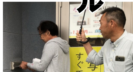
高田分会での配布

10月15日（日）、早朝から全県一斉宣伝行動にて組合のチラシを各分会から220人の仲間と家族が参加して、1万7千枚を各家に配りました。集合場所と時間と家族が参加して、1万7千枚を各家に配りました。チラシの内容は、「家のことなら地元の工務店や職人へ」の仕事おこしと、組合に未加入の方への社会保険未加入対策を含めた福建労のアピールになっており、ちらしを見てから「家の修繕をお願いしたい」などの問合せも後日きます。