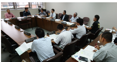
大牟田市役所での懇談と要請

時から土手にビニールシートをかぶせてある。決壊は大丈夫なの？」などの声も。地域からた声をもとに現地を住民の方を含め実行委員会で確認し大牟田市へ要望しにいけます。また、11月18日（土）は労働福祉会館で学習会が開催されます。最近は大きな自然災害が目立つ中、大牟田での災害時の対応や地域での連帯