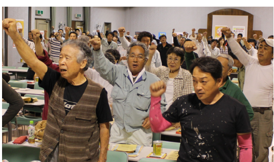
団結してがんばろう！！

9月29日（金）、支部会館2階大ホールにおいて、10月から任務に就く新分会役員と班長さんの合同会議と秋の拡大中間決起集会を開催し130人の参加でした。新年度を向かえて班長の役割と任務について学びあい、秋