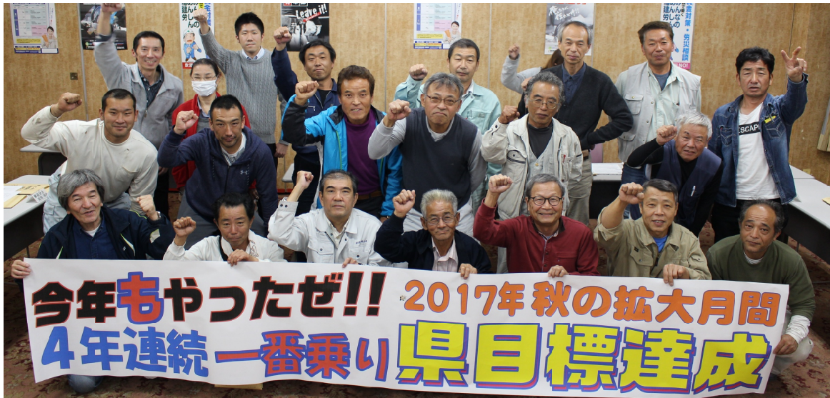
執行委員会後に県目標4年連続一番乗りを祝しました