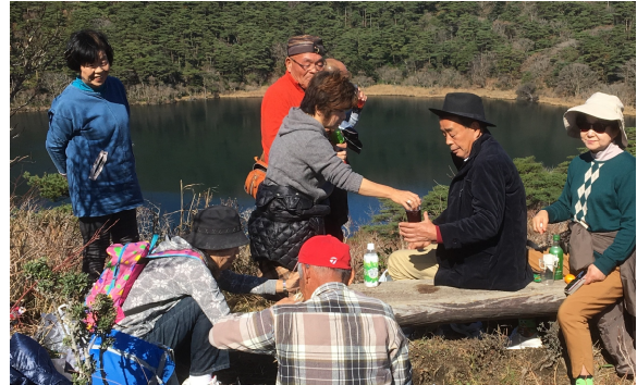
展望台で湖を眺めながらランチタイム