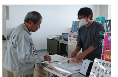
柳川市でのポスターの説明

11月13日、大牟田市、柳川市、みやま市の契約検査室や建築課に庁舎や現場への周知のためのポスターを持っていき掲示してもらおうに要請しました。