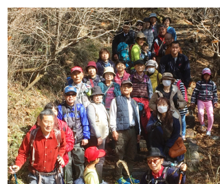
紅葉の中のトレッキング

えびの高原でトレッキング 秋晴れの紅葉狩り 組合恒例の秋の山登りとして、今回は気軽に参加できるトレッキングです。総勢33人でゆつくり、ゆつくりと秋晴れの池と空の青色に黄色や赤の紅葉がミックスされて、それはそれは素敵なトレッキングでした。白紫池六観音御池を望む二湖パノラマ展望台での昼食時に焼いたメザシや生椎茸の美味しかったこと。山ならではのアジ旨さでした。帰りはえびの高原で