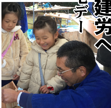
木工教室は大人気(南関分会)

11月19日(日)は南関町の関所まつりにて、南関分会の住宅デーを行いました。当日は晴天には恵まれましたが、風が強く肌寒かったため、午前中は例年と比べて、少めでしたが午後からはたくさんの方で埋め尽くされていました。住宅デーのブースにも午後になってからは、包丁研ぎとまな板削りの依頼で行列ができはじめ、「建て替えかリフォームか迷っている」と相談もありました。来場者からは「福岡から来るとね?」と尋ねられ、「違いますよ。みんな南関町の職人さんだから、家の気になるところがあったら気軽に相談して下さいね。」と地元にも多くの職人がいることをアピールできました。子どもたちに毎年大好評の木工教室。30個の貯金箱はあつという間になくなりました。