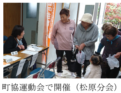
町協運動会で開催(松原分会)

10月29日(日)に松原分会の住宅デーを大正町協議会で行われる運動会の会場内で開催しました。組合員と家族12名が参加。当日はあいにくの雨となり、運動会自体が体育館の中で行われることに。住宅デーの受付場所と包丁研ぎの場所が離れた場所で行うことになり、来場者へ