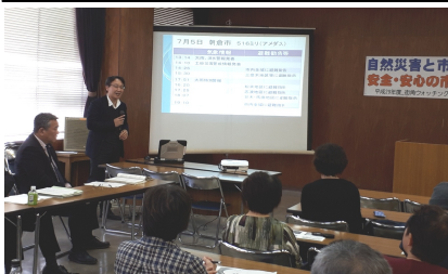
行政と一緒に学習会

11月18日(土)労働福祉会館で「安全安心の市民生活をめざして」と題して街角ウオッチング学習会が行われ、大牟田市役所の防災対策課と農林水産課を含め、32名の参加でした。防災対策課からは、大きな災害が発生して