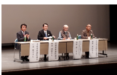
パネラーに国会議員も参加

対し、佐賀空港は建設時に佐賀県と地元漁協との間で「佐賀空港の建設に関する公害防止協定」を締結しており、