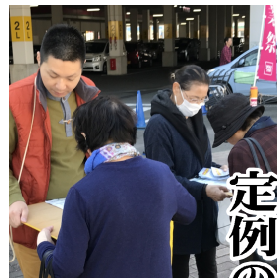
定例の街宣で世論喚起