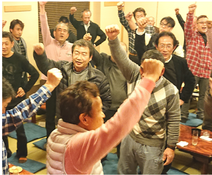
旗開きで大牟田支部の拡大出陣式