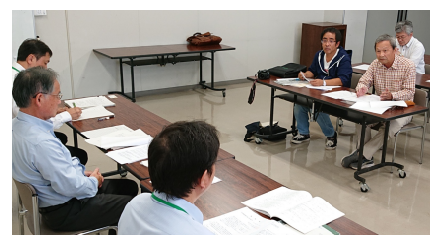
大牟田労基へ要請

じん肺 要請を行い、監督署から署長含め3人、大牟田実行委員会から5人の参加でした。