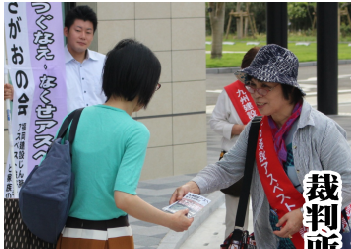
原告を先頭に宣伝

九州建設アスベスト高裁の判決が11月11日に言い渡されることになり、早期いへん重要となつてい