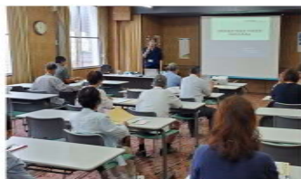
事事故例なども紹介され学習

●筑後会場：徳永産業㈱三猪倉庫 久留米市三猪町寺町原27 日時：9月6日、10月11日、 11月1日、11月21日、11月22日 (各講習日とも、午前の部9:00~12:00・午後の部13:30~16:30)