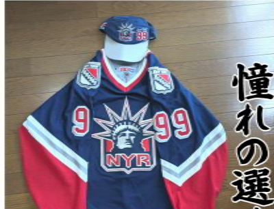
現地で入手のグッズ

自分にとって貴重な逸品や、家族にとって世界遺産と同じくらい大切なものなど紹介するコーナー。今月は歴木A分会からの紹介です。