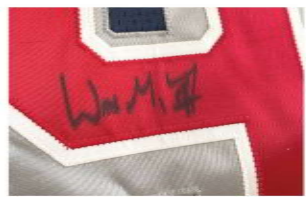
本人直筆のサインも

【坂口智之・大工】私が所有しているものの中で、かれこれ30年程大事にしているのがNHLの選手、アイスホッケーの神様、ウエイン・グレツキーの直筆サイン入りプロカップジャージ&キャップです。もちろん鑑定書もありです。日本では馴染みがないかもしれませんが、NHLはアメリカの4大メジャースポーツの一つです。学生の頃より好きで、現地にて入手しました。