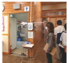
校舎を見回り確認

子供たちの安全安心の学校環境を守るための学校ウォッチングを久々に行いました。7月25日に大牟田特別支援学校に組合からは石