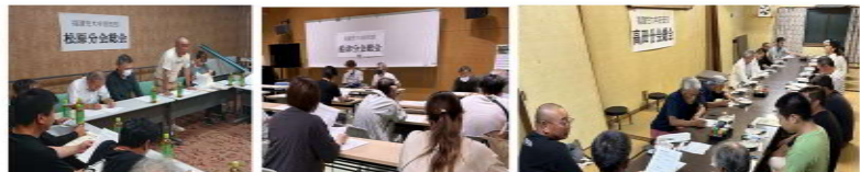
松原分会は事務所 船津分会は三川公民館 高田分会は柳屋で開催