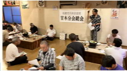
甘木分会は団炉裏焼徳永で開催