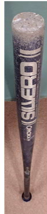
青年部活動きっかけのバット