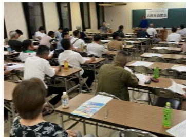
大和分会は大和中央公民館で開催 写真は8月26日までに開催した分会

分会総会は、みんなの力で実現するために分会で全組合員に呼びかけ開催しました。8月21日に荒尾分会(荒尾中央公民館)、23日に勝立分会(勝立公民館)、船津分会(三川公民館)、甘木分会(団炉裏焼徳永)、松原分会(組合事務所)、24日に高田分会(柳屋)、大和分会(大和中央公民館)、25日に歴木B分会(平野公民館)。28日に田隈分会(三池公民館)、橘分会(吉野公民館)。 野公民館)。30日は米生延命分会、駿馬公民館)、白光分会(組合事務所)、歴木A分会(三池公民館)、南関分会(関所亭)、瀬高分会(海川)、山川分会(ふじ乃や)で行いました。 総会の中で1年間のみなさんの運動の経過と「アスベスト裁判の勝利判決をかせよう」「公契約条例を制定させよう」「消費税減税・インボイス廃止へ」「平和憲法を守ろう」「仲間を増やし強大な福建労を」を中心に取組み方針を確認。また、新年度の班編成や分会での活動、分会会計報告、班長交代や班編成、分会役員や9月8日(日)に開催する支部定期大会の代議員の選出、支部執行委員の推薦などが行われ、分会長からは分会活動への協力を呼びかけました。