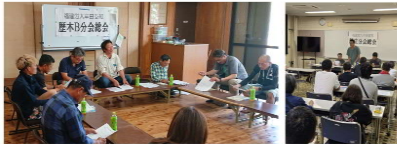
歴木B分会は平野公民館で日曜の午前に開催 勝立分会は勝立公民館