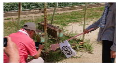
バスケットゴールの安全確認

先月の大牟田市立支援学校に続き、8月21日は手鎌小学校をウォッチングしました。早急な対応が必要な箇所として、夏休みには学童保育の遊び場として使用している体育館にて、壁コンセントのカバーが割れて金属部が露出。そして、運