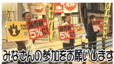
みなさんの参加をお願いします

定例の消費税廃止宣伝は、11月25日に東新町交差点で実施しました。 12月20日は消費税廃止各界連の仲間と県内大宣伝に取り組みます。多くの参加で世論をひろげ運動を進めましょう。