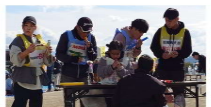
うまい棒3本の障害物に苦戦

結果は9位となりま したが、大牟田支部一 丸となって奮闘し、楽 しみました。 閉会式では年明けの 福建労本部70周年記念 式典までに福建労全体 で16000人到達を めざそうと団結しまし た。