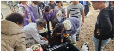
金魚すくい親子連れの来客アップ

秋の地域の祭りとお合 わせて、松原分会が大 正まつりの会場で、南 関分会は関所まつりの 会場で住宅デーを開催 しました。