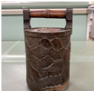
特殊な細工が施された水筒

自分にとって貴重な逸品や、家族にとって世界遺産と同じくらい大切なものなど紹介するコーナー。今月は高田分会からの紹介です。