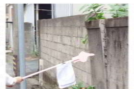
今にも倒れそうなブロック塀をチェック

夏の学校ウオッチングに続いて、街角ウオッチングで地域の危険箇所を11月15日に確認しました。今回は本町から旭町付近を調査。崩れかけている空き店舗や倒れ掛かっているブロック塀が通行者に危険を及ぼす箇所が多数ありました。また、側溝や道路の舗装、草木の伐採が必要な箇所も。踏切では段差がひどく、車椅子での通行が困難と思われるところも確認。改善の工事が必要な16箇所を確認しました。改善要望としてまとめていきます。