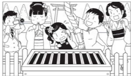
【問題】上の絵と下の絵では7つのマチガイがあります！どこでしょう？(作・野上和孝)