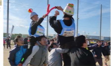
後からの攻撃にも警戒しながら対戦