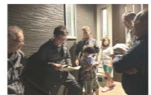
高田分会の仲間訪問

10月と11月の本月間 は毎週木曜日を全県の 拡大統一行動日として、 全組合員訪問に取り組 みました。訪問グッズ の「ノリノリ梅」も作 成し、班長と分会役員 を中心に行動し、秋の 大運動への協力を呼び かけました。 すぐには拡大につな がらないこともありま