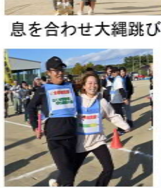
息を合わせ大縄跳び