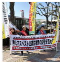
大牟田駅前前で宣伝

子が描かれていました。はじめは自衛隊の駐屯地をつくるだけと説明を聞いていたがミサイル配備までされることに。住民たちが必死に座り込みなどで抵抗。拡声器で抗議し続ける老婆は「有事になれば島が戦地になり島民は見殺しなのか。話が違う」と詰め寄ります。島民がどう抗っても日本政府には言葉が通じない無力感が映し出されていきました。軍事産業大国のアメリカの言いなりになっている日本政府は、今もアメリカの植民地なのかと痛感させられるドキュメンタリー映画でした。