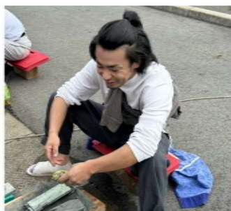
包丁研ぎで地域へアピール

まな板削り6 枚の61人に対 応し、住宅相 談は2件あり ました。玄関 のリフォームを考えて いる地域の方は近くの 職人さんに相談できて