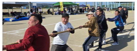
力自慢の出場で綱引きは勝利