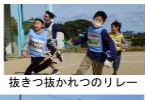
抜きつ抜かれつのリレー