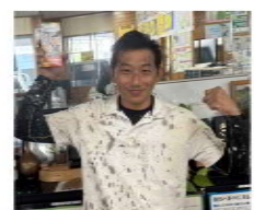
分会長の2人拡大で達成させた甘木分会

差点でのおはよう宣伝 を実施。各分会でも出 陣式を開催し月間にの ぞみました。新しい仲 間は25人の拡大となり 達成はできませんでし た。分会でみれば甘木 分会と田隈分会が達成 となりました。