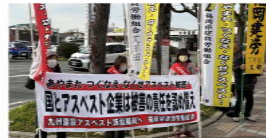
大牟田駅まえで定例宣伝