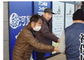
ゆめタウンで宣伝