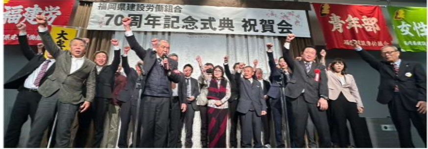
大牟田支部の60周年も仲間を増やしてむかえると決意