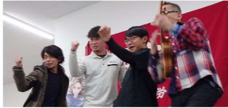
息もびったりの青年部