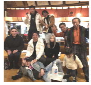
分会青年交流会(甘木分会)

「確定申告がわからない」「建設業の許可や入札について」「CCUSの就業履歴が組合でできるか？」など困っている仲間へいたら紹介と周りへの声掛けをお願いします。