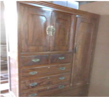
父親の仕事姿を思い出す筆筒

自分にとって貴重な逸品や、家族にとって世界遺産と同じくらい大切なものなど紹介するコーナー。今月は瀬高分会からの紹介です。